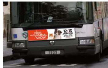
Avant bus - 2000 faces/7 jours