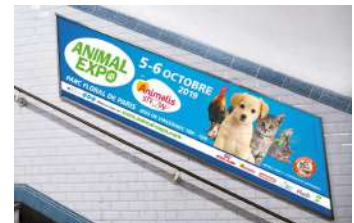
Rampe métro - 810 faces/14 jours