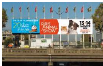
Périphérique - 14 jours