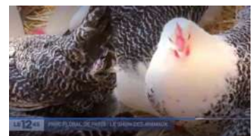
Une couverture médiatique sur les plus grandes chaînes nationales